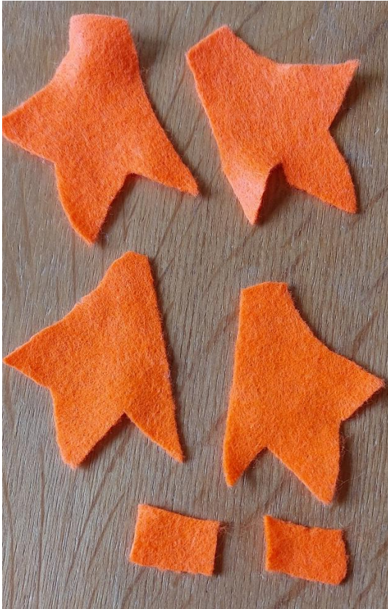
farbiger Filz: Krallen und Schulterstückchen