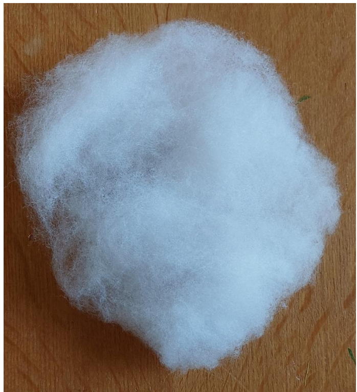
Füllmaterial für die Krallen